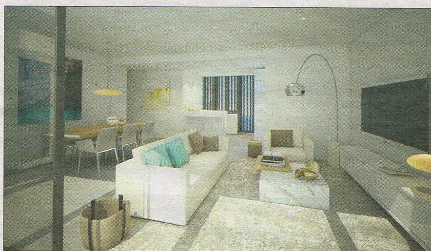
Hay una distribución abierta: cocina, salón y comedor se unen en un mismo espacio.