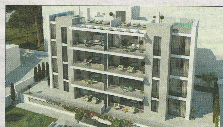
El carácter innovador del exterior se traslada también al interior de las viviendas.