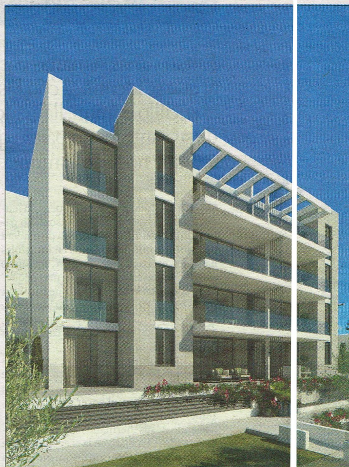
Hay dos zonas exteriores comunes.

MIGUEL CHACÁRTEGUI BORRÁS