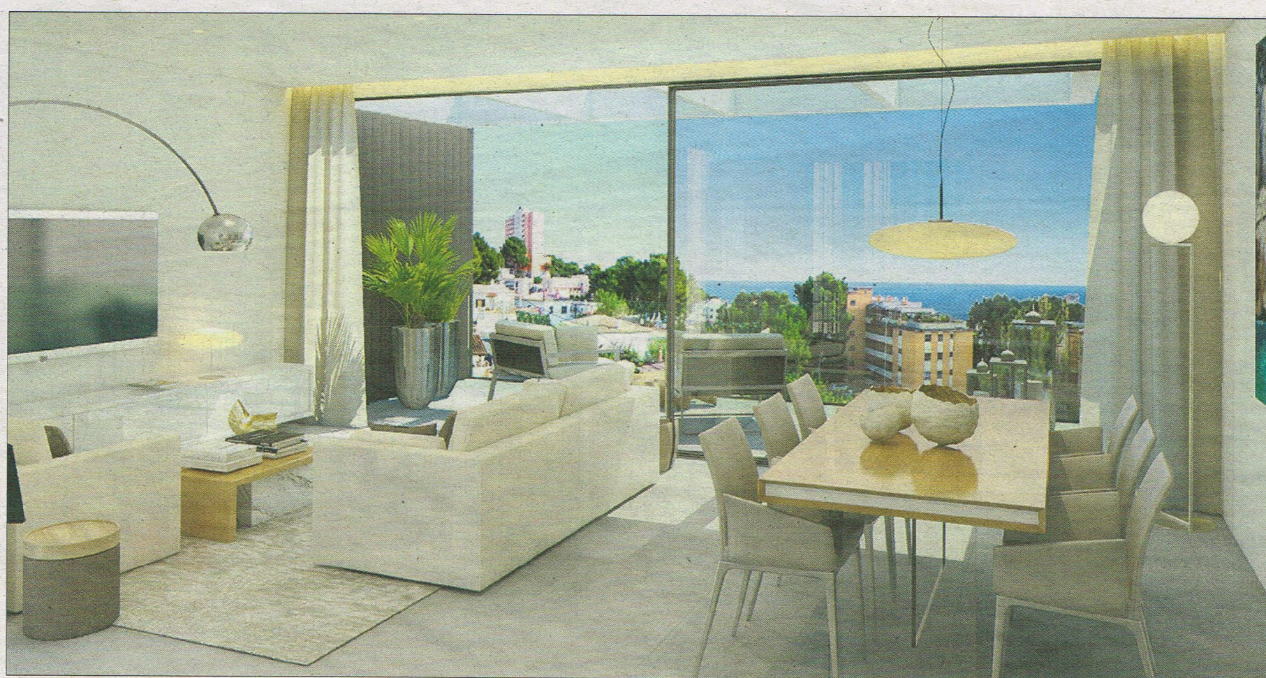
Grandes cristalerías situadas en los salones de cada vivienda, permiten que reciban iluminación natural.

► PARA CONTACTAR CON 'LA CASA' BFONT@DIARIODEMALLORCA.ES