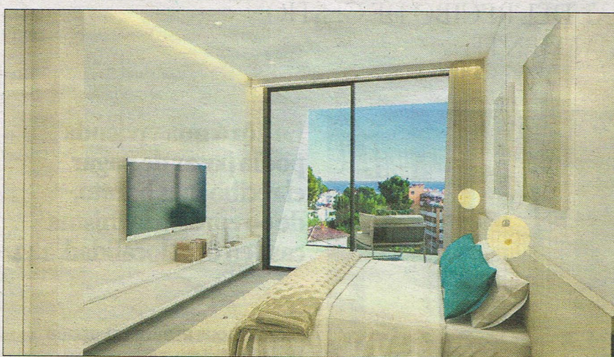
Una de las habitaciones, luminosa y con unas vistas espectaculares.