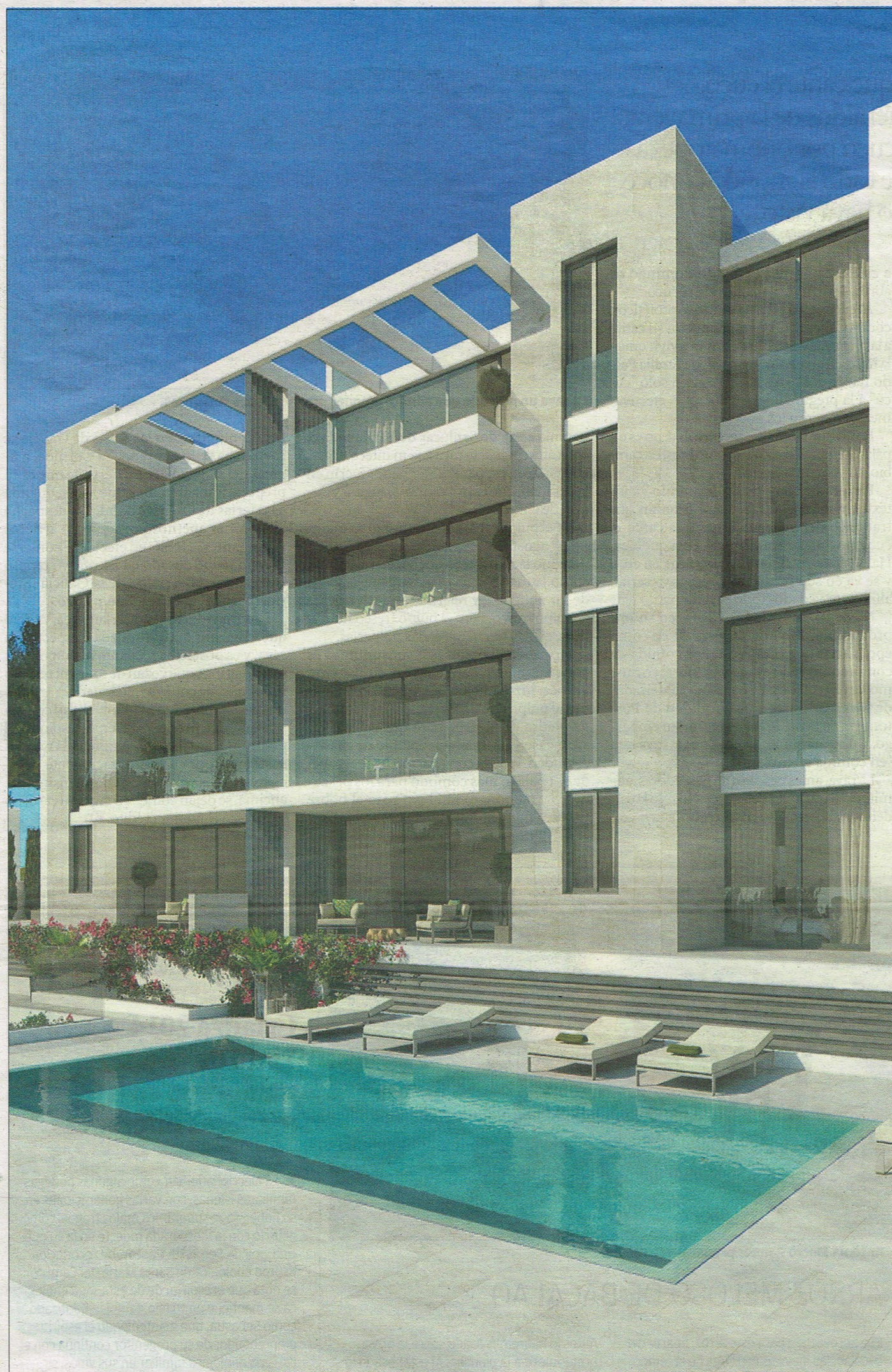
Los dos bloques forrados de piedra sobre los que se sustenta el edificio, ayudan a otorgar una imagen tranquila y ordenada.