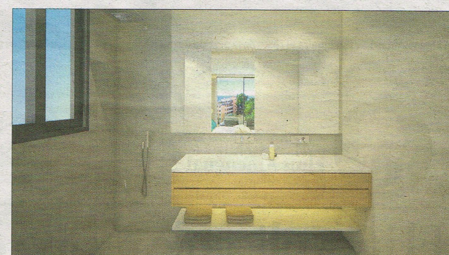
Uno de los baños modernamente equipado y con vistas al exterior.